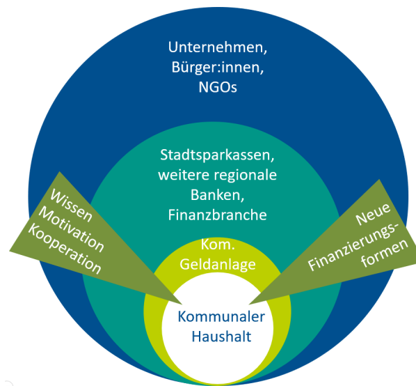
Abb. 2: Zusammenwirken kommunaler Handlungsfelder und Akteur:innen für eine optimale Finanzierung der nötigen Transformation

Der vorgeschlagene Aktionsplan, der sich im Kern auf die Bausteine Motivieren, Bilden und Vernetzen konzentriert, wird in diesem Bericht vorgestellt. Er beschreibt fast 30 Maßnahmen, die aus bestehenden, erweiterbaren und neuen Aktivitäten zusammengestellt sind.