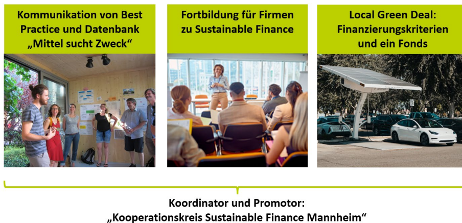
Abb. 3: Beispiele für Vorschläge aus dem Aktionsplan Nachhaltigkeit Finanzieren Mannheim 2

Der hier präsentierte Vorschlag für einen Aktionsplan kann nur als ein erster Ausgangspunkt für eine gesamtstädtische Strategie verstanden werden. Die Veröffentlichung des Aktionsplans ist ein Impuls, der hierzu von relevanten Akteur:innen und in der städtischen Politik aufgegriffen werden kann.